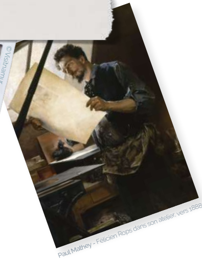
Paul Mathy - Félicien Rops dans son atelier, vers 1888